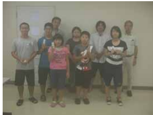
〔参加者と記念写真〕