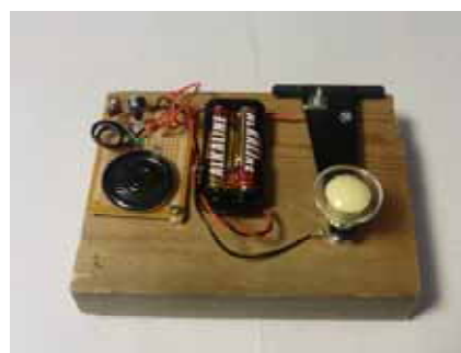
〔こどもキーと発信器〕