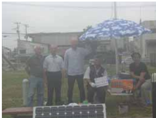
〔移動運用に使用した太陽光パネル〕