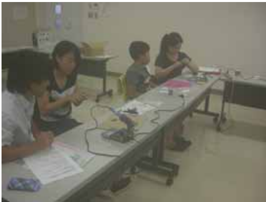
〔昨年度のFMワイヤレスマイク作製風景〕

また、参加して頂いた5人全員に、当クラブから特別プレゼントとして、ポ - タブルAM/FMラジオ 1000円相当品を進呈しました。